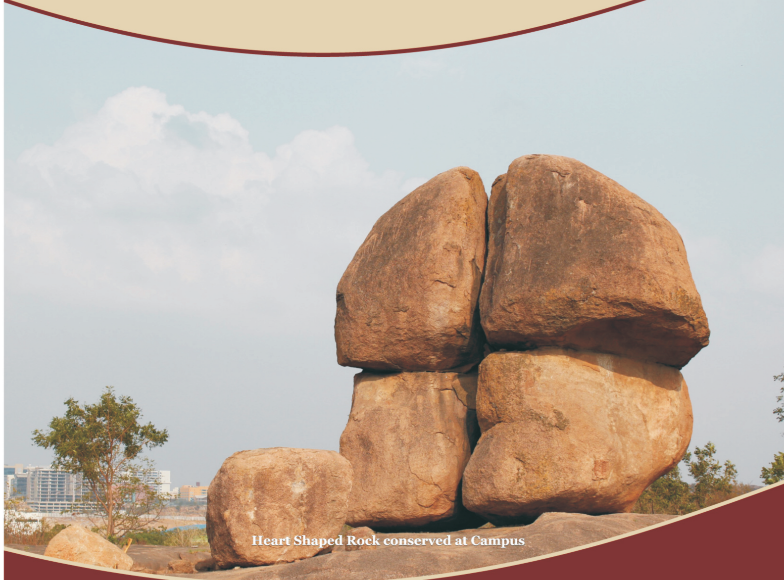
Heart Shaped Rock conserved at Campus